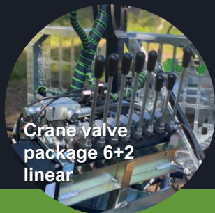
Crane valve package 6+2 linear