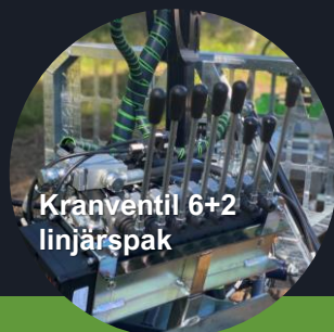
Kranventil 6+2 linjärspak