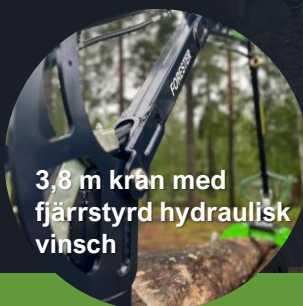
3,8 m kran med fjärrstyrd hydraulisk vinsch