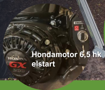
Hondamotor 6,5 hk elstart