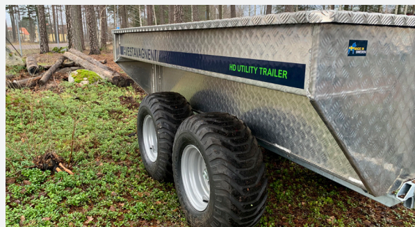
Vagnen på bilden kan vara extrautrustad