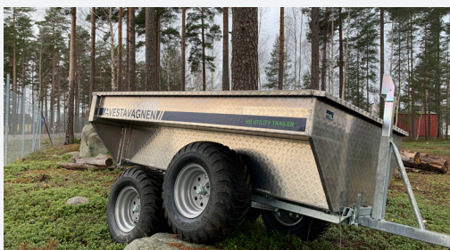
Heavy Duty Utility Trailer Vagnen på bilden kan vara extrautrustad

Genom att utrusta din Heavy Duty Utility Trailer med en Warn Provantage elvinsch kan du smidigt lasta vagnen med timmer eller vinscha upp djur vid jakt. Elvinschen, med en kapacitet på 1134 kg, monteras enkelt på vinschfästet som finns att köpa till. Har din ATV en bakmonterad vinsch rekommenderas att du monterar en höj- och sänkbar linstyrare på vagnen (finns att köpa som tillbehör). Om vagnen ska användas för transport av jord, sand eller ved finns en hög baklucka som tillval för att kunna lasta maximal volym. Den höga bakluckan är, liksom den medföljande luckan, fullt vikbar och kan avlägsnas helt. Vagnen har ett vridbart drag med två draghjänder vilket gör att vagnen både kan kopplas till lägre eller högre dragfordon.